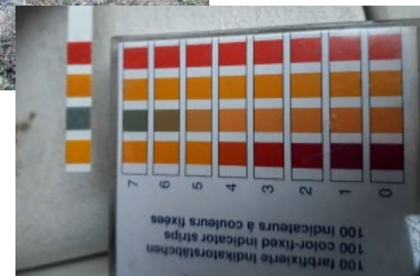
2018-9-7: pH måling ved Møllerand (pH 8)