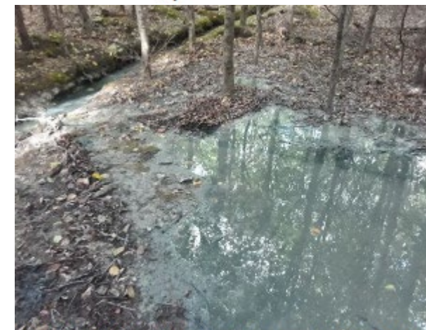
6 2018-9-8: Besigtigelse af skadested-