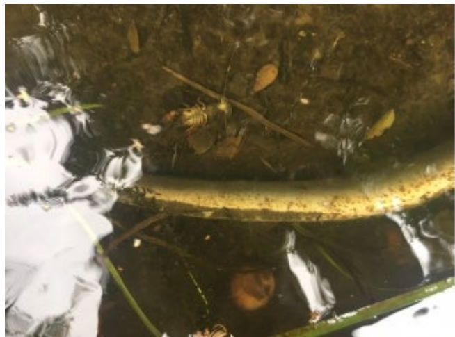
#33 2018-9-14: Trønningemose, død ål og signalkrebs