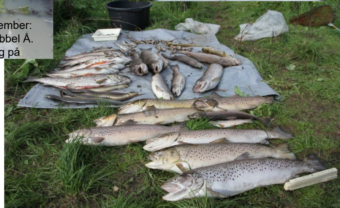
Søndag d. 9. september: Døde havørreder og andre arter opsamlet fra Tuse Å ved Nybro og Tuse